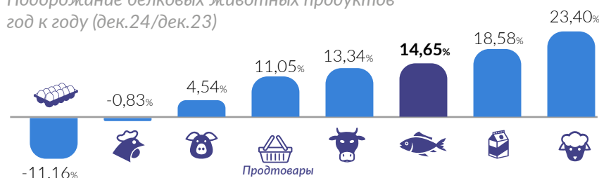
Подорожание белковых животных продуктов год к году (дек.24/дек.23)

яйца — показали снижение, что объясняется эффектом высокой базы (по итогам декабря 2023 года яйца подорожали на 61,35% год к году, а курицы — на 27,77%, в то время как показатель по рыбопродуктам за тот же период составил всего 5,27%). Поэтому в случае с курицей и яйцами речь не столько о снижении цен, сколько о частичной компенсации их резкого повышения.