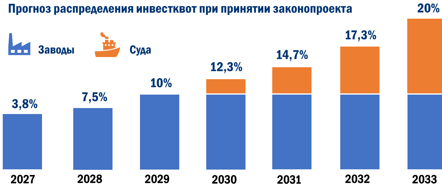
Прогноз распределения инвестквот при принятии законопроекта

Механизм предусматривает долгосрочный переходный период - заявки с ПСД, договора на постройку, финэкспертизу, отбор проектов, заключение инвестдоговоров с Росрыболовством, постройку объектов – длится до 9 лет . Размер исторических квот постепенно изменяется и сохраняется до этого срока.